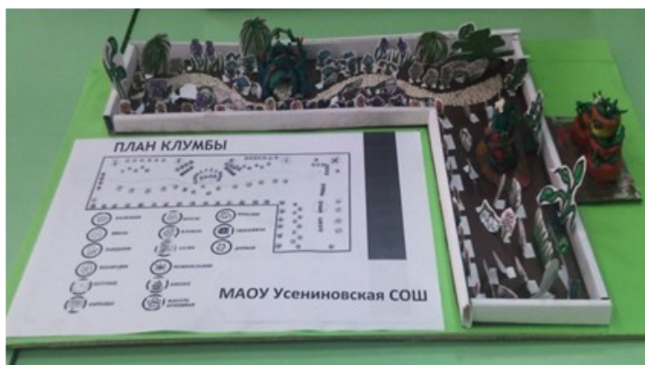
КЛУМБА В ПРОЕКТЕ